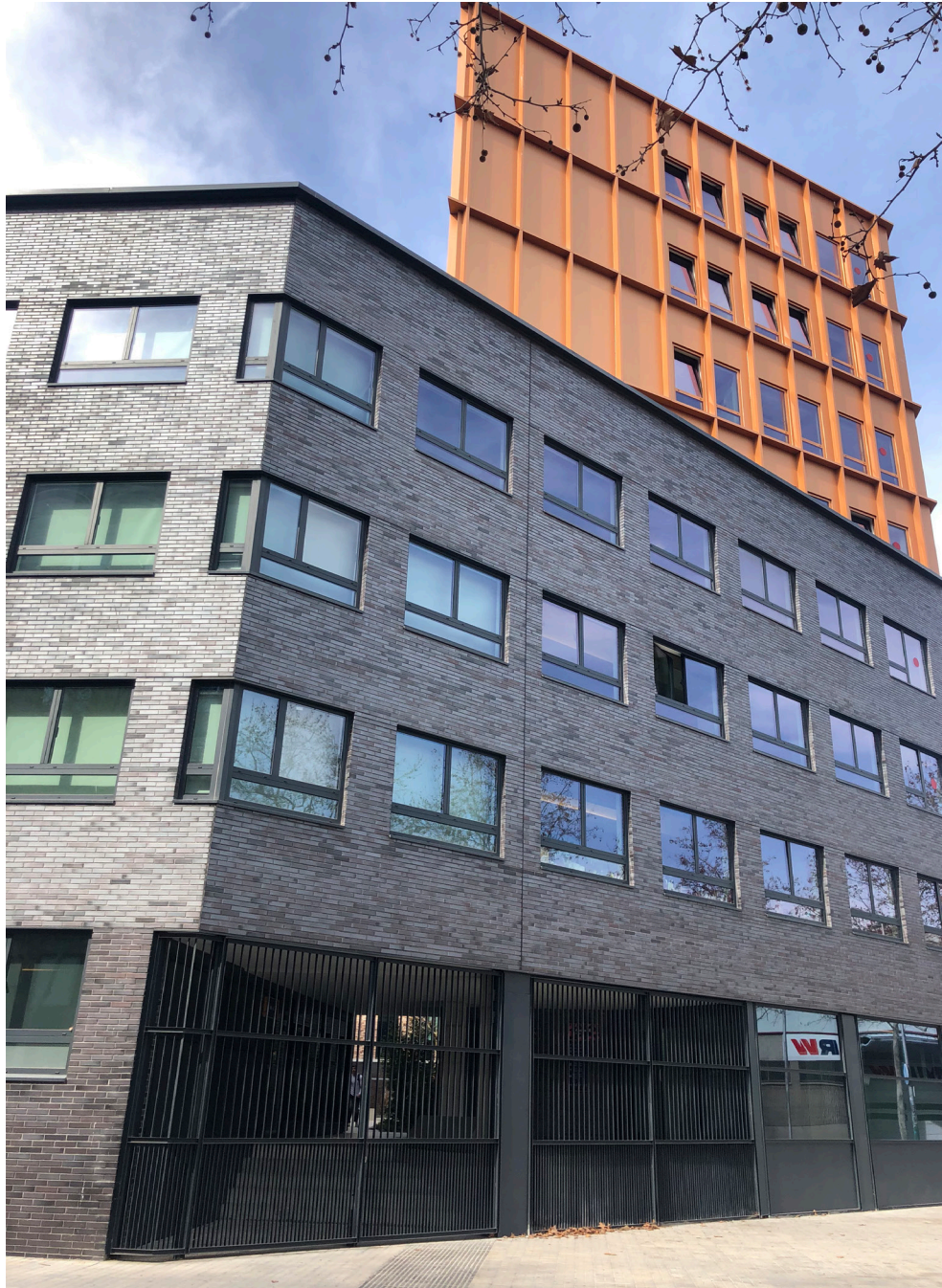
Edifici actual que ocupa la vessant sud de l'illa