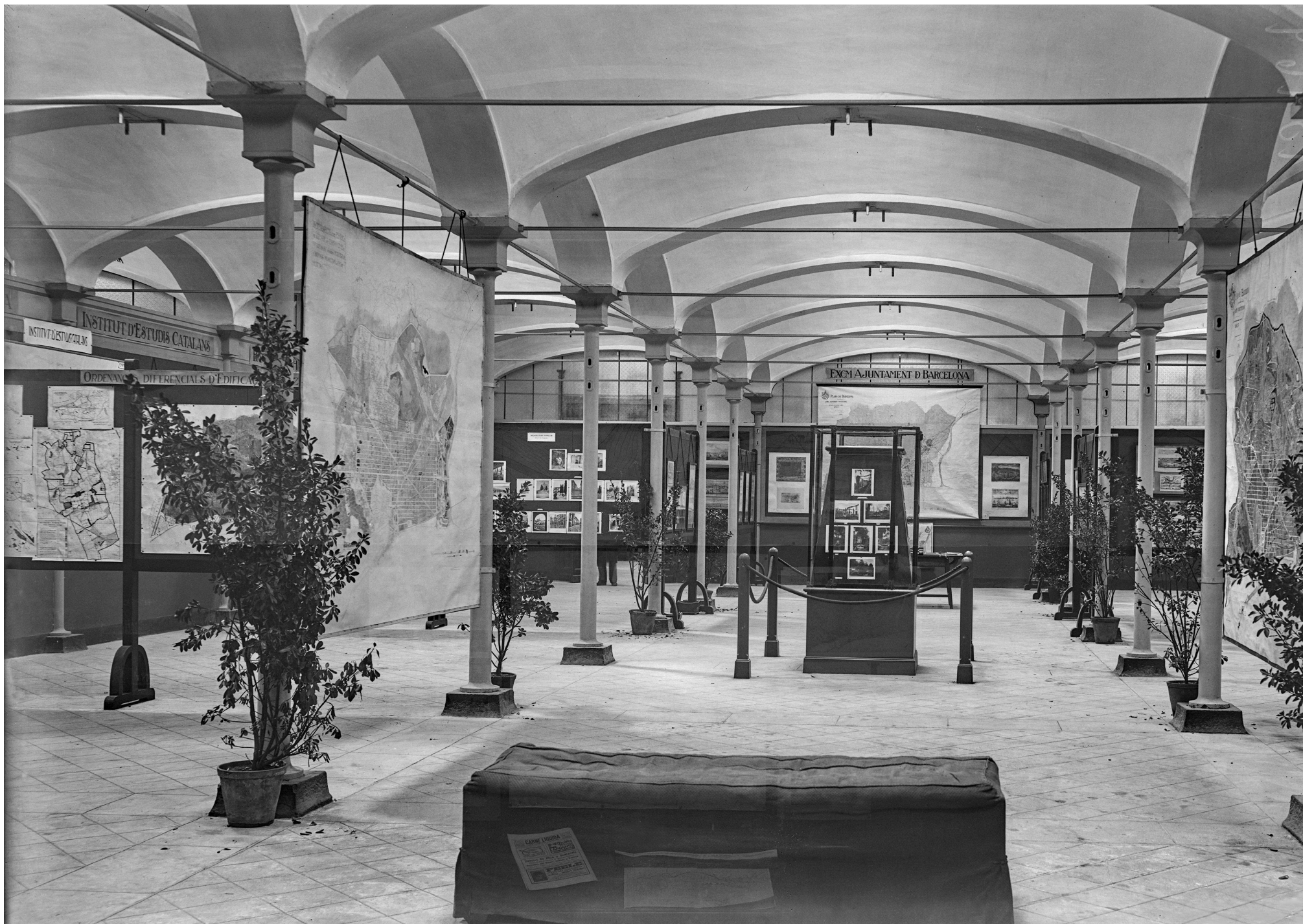
Exposició de construcció cívica i habitació popular, Museu Social de Barcelona, 1916.