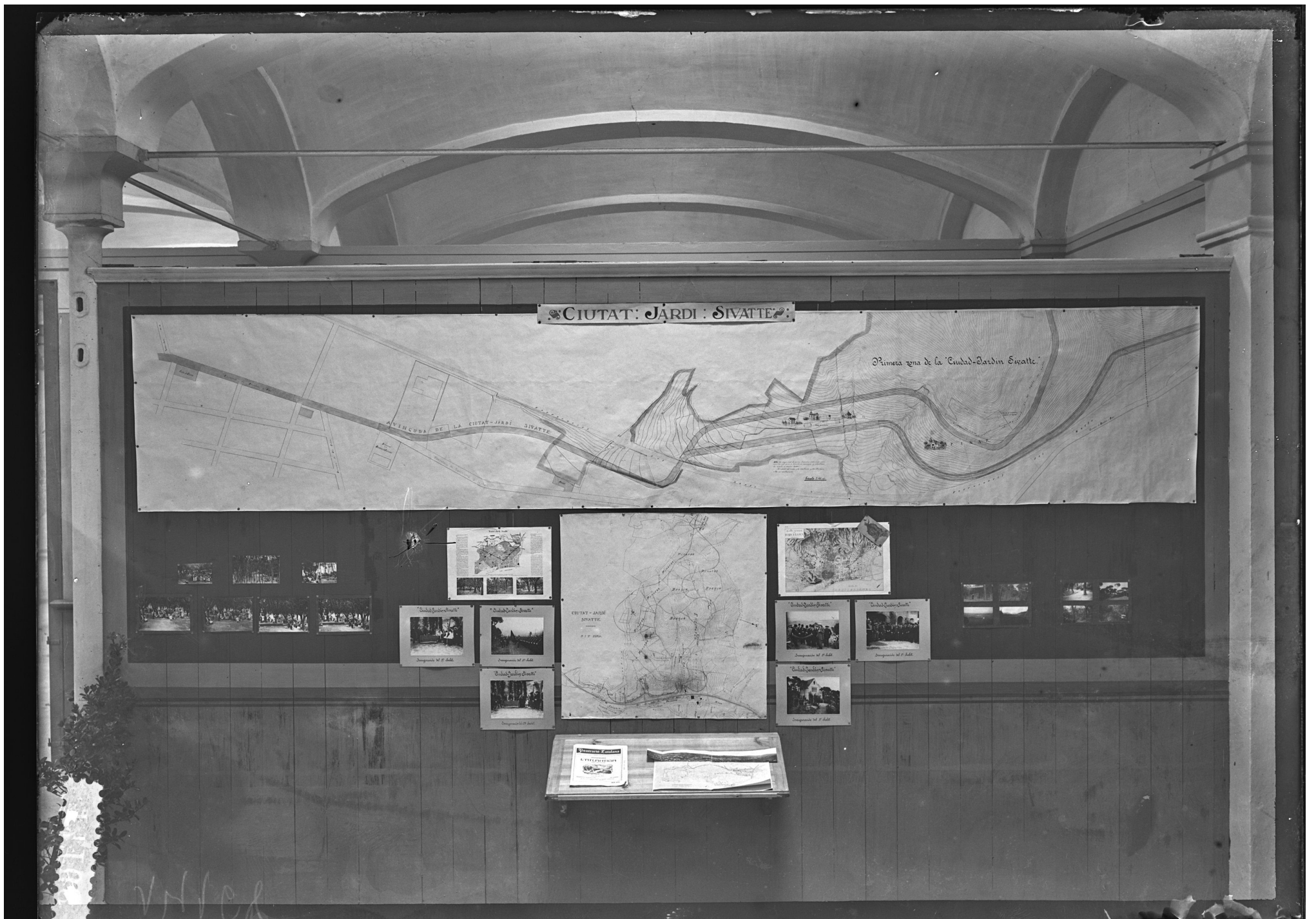
Exposició de construcció cívica i habitació popular, Museu Social de Barcelona, 1916.